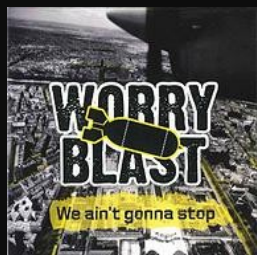
We ain't gonna stop EP - 2012