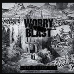
Break Out From Hell ALBUM - 2013