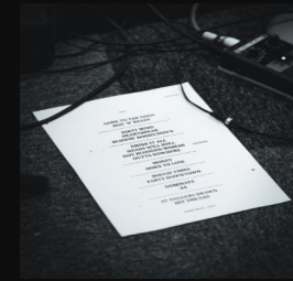
Nouvel Album 2027