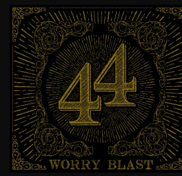
.44 ALBUM - 2018