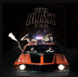
Hit The Gas ALBUM - 2016