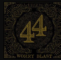
.44 ALBUM - 2018