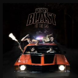
Hit The Gas ALBUM - 2016